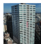
TKP仙台 カンファレンスセンター 宮城県仙台市青葉区花京院1-2-3 ソララガーデンオフィス 2F/3F/4F (事務所 3F)